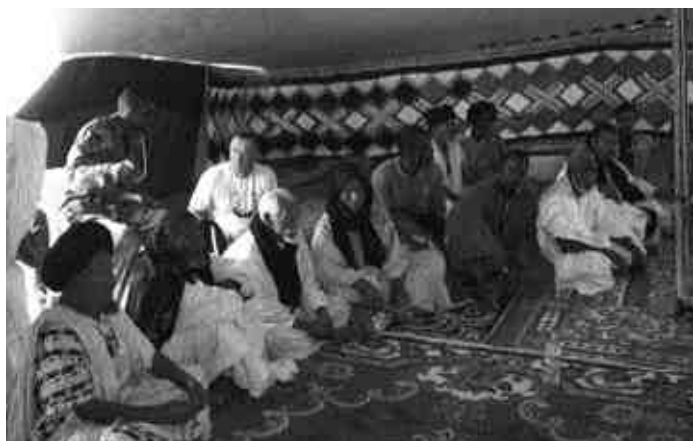
Représentants des Imraguen