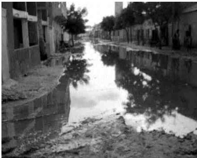
Avenue Boubarac Sy à Rosso Vingt-neuf millimètres et la ville se noie.

Cet article est paru il y a un an. Depuis les choses ont changé. Rosso a un nouveau visage. Nous avons voulu le mettre à côté de ce reportage.